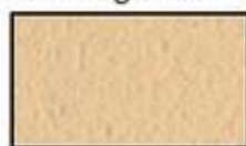
F12- Brun rosé