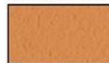
F18- Ocre doré