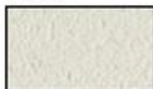
F5- Gris beige