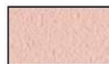
F15- Rose poudre