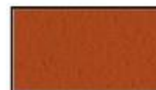
F14- Rouge terre