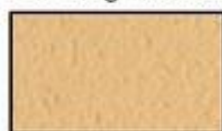
F11- Beige ocre