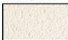
F2- Blanc cassé