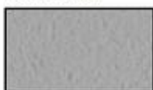
F6- Gris argent