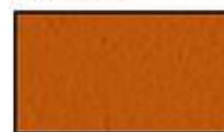
F17- Rouge cuivré