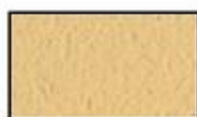
F10- Beige naturel