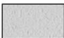
F5- Gris clair