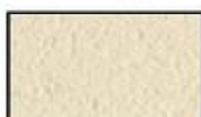
F4- Pierre naturelle