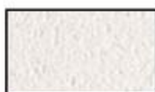
F1- Blanc écri

Non exhaustif, le nuancier ci-dessous propose une gamme de coloris vers laquelle tendre s'étalant du blanc écri (F1) au rouge terre (F14).