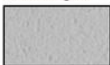
F7- Gris perle